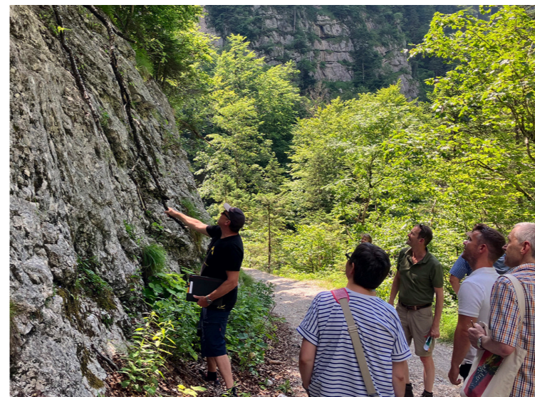
Details vom R.A.G.N.A.R.-Experten

Wenn ein Schaden auf eine Verletzung der Sorgfaltspflicht sowohl des Baumhalters als auch des Wegehalters zurückzuführen ist, haftet jeder der beiden nach den für seine Haftung geltenden Grundsätzen – es besteht Anspruchskonkurrenz. Ein durch einen Baumsturz auf einen Weg Geschädigter kann seine Haftung sowohl gegen den Baum- als auch den Wegehalter stützen. Anders als der Wegehalter wurde jedoch dem Baumhalter mit § 1319b ABGB kein Haftungsprivileg erteilt, der Baumhalter haftet – anders als der Wegehalter – auch für leicht fahrlässiges Verhalten. Entschärft wird dieses Ungleichverhältnis jedoch dadurch, dass der im Fall des Baumhalters anzulegende Sorgfaltsmaßstab nach den in § 1319b Abs 2 ABGB maßgeblichen Kriterien sachgerecht abgestuft ist (siehe „Leitfaden Baumsicherheitsmanagement“)