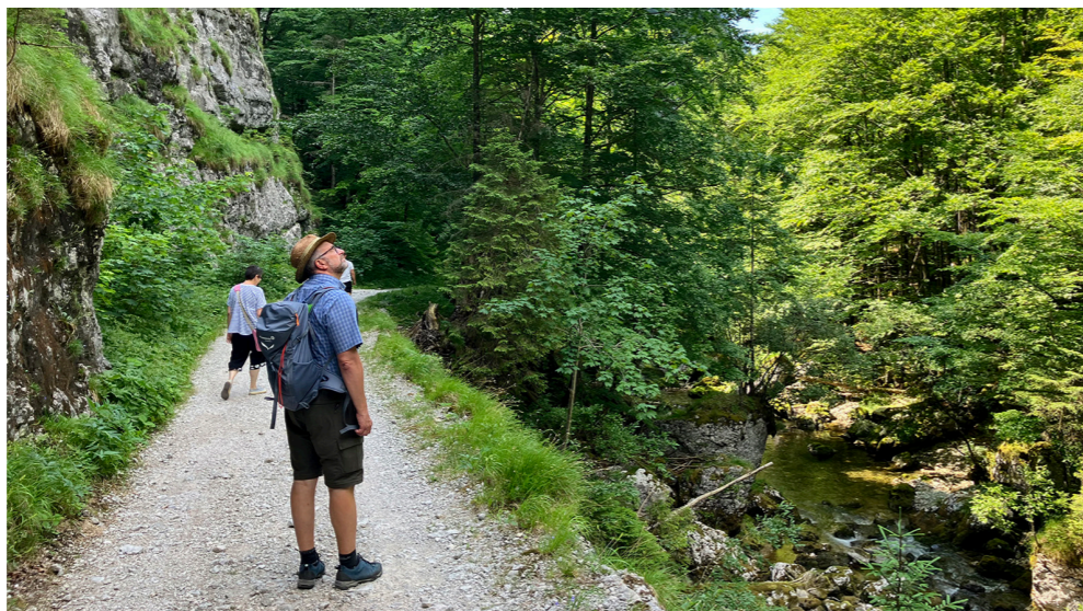
Hangabräumung – eine Frage der Zumutbarkeit