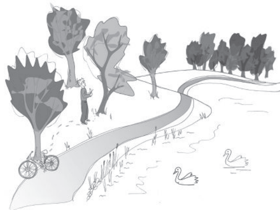
Abb. 1: Vertiefende Baumsicherheitsbegehung.

Im dritten Schritt wird beschrieben, wie unter Anwendung der unterschiedlichen Standards Baumprüfungen durchzuführen sind, Gefahren erhoben werden, notwendige Maßnahmen geplant und schlussendlich dokumentiert werden.