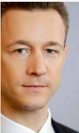
Vizekanzler Werner Kogler (oben) und Finanzminister Gernot Blümel sind die Fachminister, auf deren Schultern die großen Brocken Verwaltung und Finanzen lasten.

programm zwar nicht eindeutig entnehmen. In einem anderen Zusammenhang wird aber davon gesprochen, dass Integrationsförderungen auch von Gemeinden in die Datenbank aufgenommen werden sollen. Der Gemeindebund hat in der Vergangenheit aber ohnedies immer wieder betont, dass die Gemeinden in diese Datenbank einmelden würden, sollten die erforderlichen Einschleifregelungen getroffen werden (so etwa eine Bagatellgrenze).